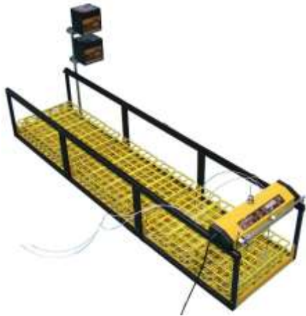
Zwei Erweiterungen für 30 mm Röhren: Dreifache Kapazität (288 Fraktionen)

Die Zahl der Erweiterungen ist frei wählbar. Hier finden Sie einige Anwendungsbeispiele: