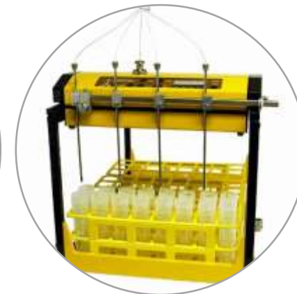
4 Ströme konfiguriert