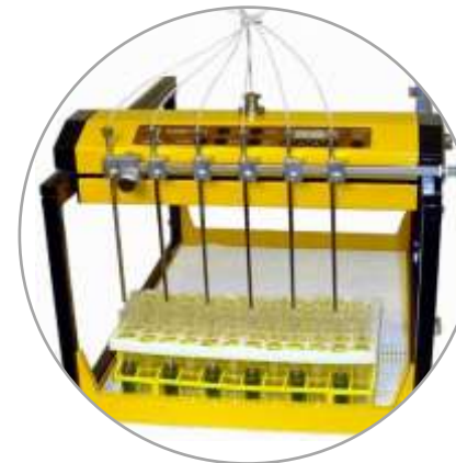
6 Ströme konfiguriert