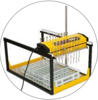
20 Ströme (2 x 10) konfiguriert

LAMBDA liefert Fraktionssammler auch mit Mehrkanal-Anordnung: OMNICOLL für 2 bis 20 Ströme basierend auf Ihrer Projektanforderung. OMNICOLL ist dank seinen individuell anpassbaren Anordnungen der Spitzenreiter unter den Fraktionssammlern weltweit.