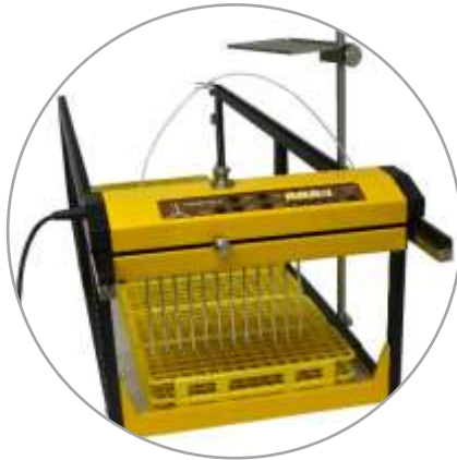
12 (1 x 12) Ströme konfiguriert