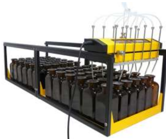
Eine Erweiterung für 250 ml Flaschen: Doppelte Probenkapazität (72 Behälter)