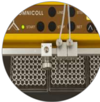
2 Ströme konfiguriert